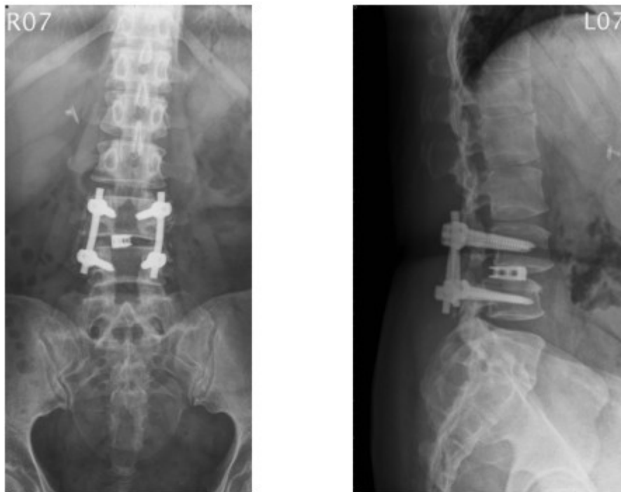
鈦金屬椎釘及鈦金屬支架固定椎體

治療的目的是要解除神經的壓迫，消除疼痛並保持結構的穩定性。目前大多主張後方椎間螺釘融合固定術再加上徹底的減壓手術。目前由於醫材研發的進步，例如人工骨材、鈦合金的椎釘及鈦金屬支架(Cage)的發展都使病人能得到很好的療效。